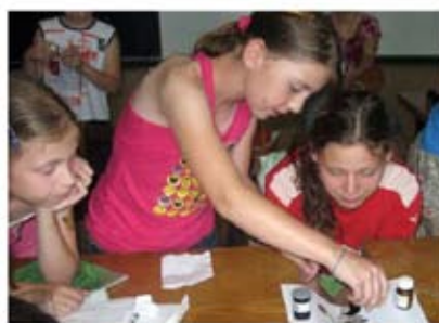
SCHOLA LUDUS: Papierová Fyzika, podporená suma: 2 640 €, Bratislava

Vo februári 2009 sme vyhlásili 1. kolo tohto grantového programu. na program sme vyčlenili sumu 35 000 EUR [1 054 410 SK] a podporili sme celkovo 18 vybratých projektov . Zo všetkých podporených projektov spomeňme aspoň aktivitu na zvýšenie povedomia