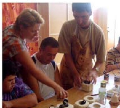
Dajme šancu „iným“: podporená suma: 2 500 €, Vranov nad Topľou

Cieľom tohto programu je podporovať aktivity, ktoré pomáhajú ľuďom v nepriaznivej sociálnej či zdravotnej situácii zaradiť sa do spoločnosti a znižujú ich sociálnu izoláciu. V roku 2009 bolo vyhlásené 1. kolo tohto programu. na program sme vyčlenili sumu 100 000 EUR [3 012 600 SK] a podporili sme 51 projektov . Zo skutočne veľkého množstva vybratých projektov spomeňme, že sme podporili vytvorenie chránenej dielne pre ľudí s mentálnym postihom vo Vranove nad Topľou, projekt rodinnej terénnej terapie abstínujúcich