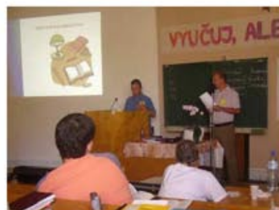
Deti sa učia: Vyučuj, ale ako? (Celoslovenská konferencia DM), podporená suma: 1 300 €, Martin

A. Kmeťa v Leviciach, zaujímavú výstavu „Meranie času“ v Ponitrianskom múzeu alebo rozvoj žiackych eko-hliadok v Kremnici.