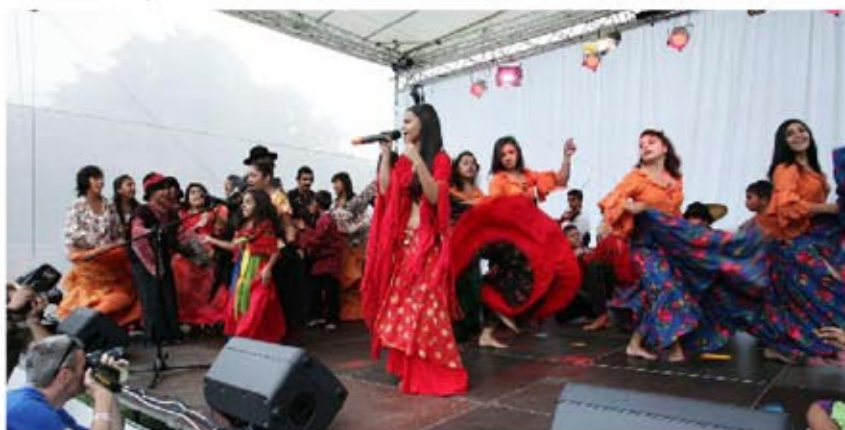
Letná akadémia Divých makov 2009

happenings v uliciach slovenských miest pod názvom Spolu pri stole , stretnutia v rámci rodičovských komunít, vysvetľovanie rozdielov medzi pestúnskou starostlivosťou a adopciou a ďalšie aktivity. Prebieha aj MMS hra Čo robíme spolu (do ktorej sa stále môžete zapojiť aj vy na čísle 0918 11 11 55).