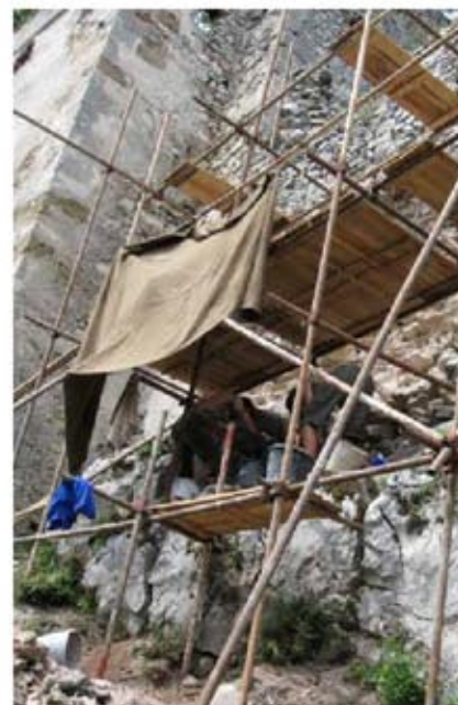
Renova: Záchrana hradu Dobrá Voda, podporená suma: 3 000 € [90 378 Sk], Dobrá Voda