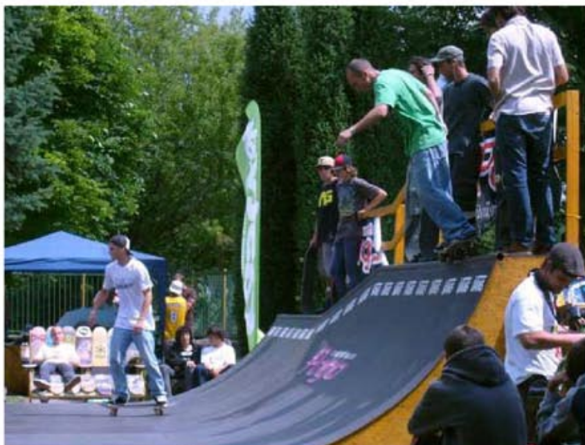
Rider4riders, o. z.: Miniramp session 09, podporená suma: 2 200 € [66 277,20 Sk], Prešov

Ďalší ročník programu „Šanca pre váš región“ bude vyhlásený na jar v roku 2010.