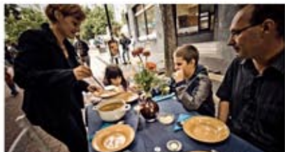
Happening SPOLUPRISTOLE v uliciach Bratislavy

Občianske združenie Návrat realizuje v tomto roku okrem iných aktivít aj projekt Spolu. Jeho cieľom je vyzdvihnúť hodnotu času stráveného v rodinnom kruhu a vyzvať