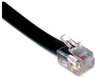
Obr. 11: Telefónny kábel s koncovkou RJ11