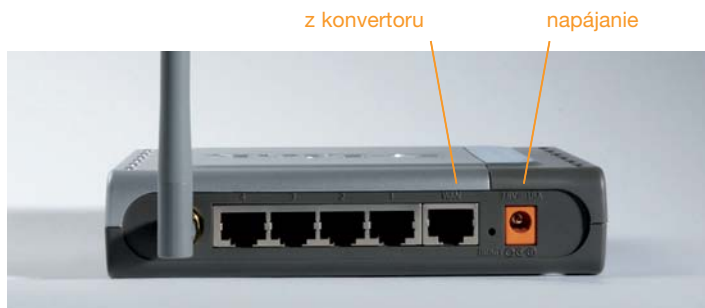
Obr. 5: Pripojenie káblu do Bezdrôtového smerovača