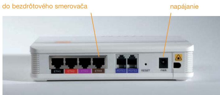
Obr. 4: Pripojenie káblu do Konvertora