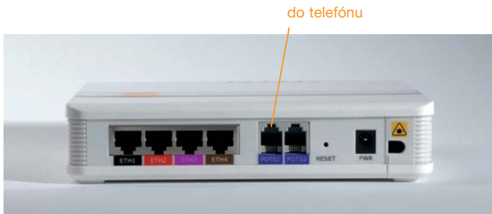
Obr. 12: Zapojenie telefónu do Konvertora