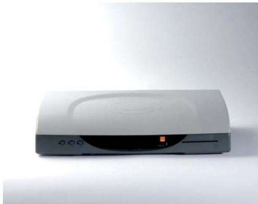
Obr. 1: Set-Top-Box

je zariadenie, ktoré slúži na spracovanie digitálneho signálu a umožňuje sledovanie Fiber TV na bežných TV prijímačoch a tiež dáva možnosť používať službu Video na požiadanie. Set-Top-Box Sagem IAD 81 HD podporuje vysoké rozlíšenie (Full HD) a Set-Top-Box Sagem ITAD 81 SD podporuje štandardné rozlíšenie (SD).