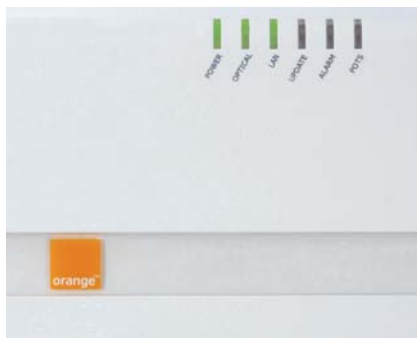
Obr. 6: Signalizácia diód – Konvertor