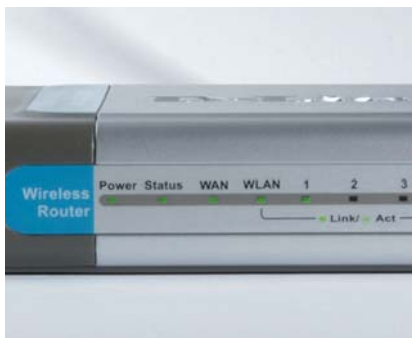
Obr. 7: Signalizácia diód – Bezdrôtový smerovač