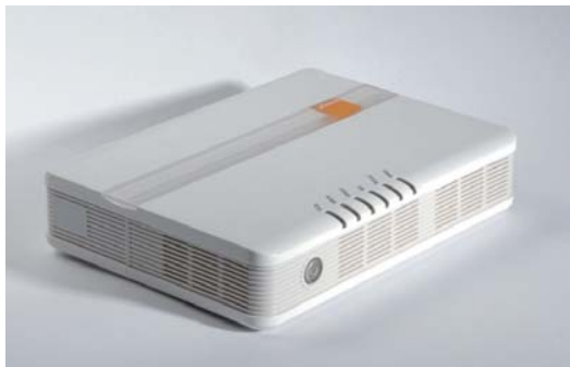
Obr. 2: Konvertor