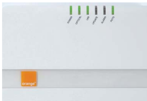
Obr. 13: Signalizácia diód pri zodvihnutom telefóne