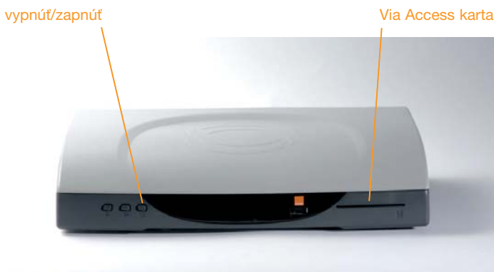
Obr. 10: Kontrola Set-Top-Box-u