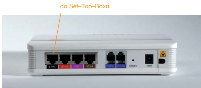
Obr. 9: Pripojenie káblu do Konvertora