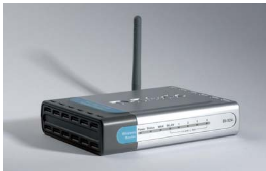
Obr. 3: Bezdrôtový smerovač

umožňuje pripojenie na internet a zároveň má funkcie firewallu. Podporuje bezdrôtové pripojenie počítačov a notebookov (Wi-Fi).